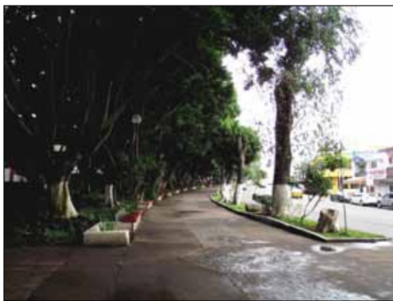
Figura 1. Parque la Loma de Tepic Nayarit, México.

El lugar en el que vivimos, puede convertirse en un sitio muy distinto al que originalmente existía años atrás, pues la urbanización es un proceso que transforma el entorno de manera drástica y a veces a un ritmo muy acelerado, a tal grado que es difícil que podamos concebir a la ciudad como un ecosistema en sí mismo; Sin embargo, la ciudad constituye el centro de toda una red de interacciones, tan diversas que es capaz de impactar la región, plasmando en ella su huella ecológica. Este “ecosistema urbano”, está constituido por al menos cuatro núcleo básicos, 1) Las áreas mineras, 2) Las áreas rurales, 3) Las áreas de asentamientos vecinos y 4) Las áreas naturales (Camargo, 2008).