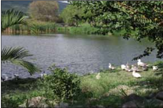
Figura 3. Parque Ecológico de Tepic, Nayarit, México.