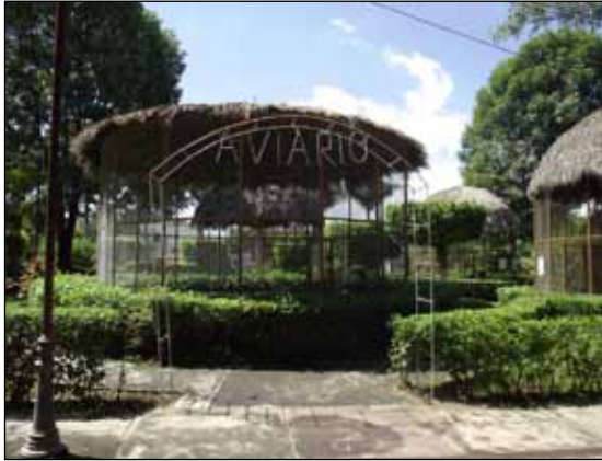
Figura 2. Aviario de la Alameda, en Tepic, Nayarit, México.

El espacio público destinado al uso colectivo debe ser un lugar accesible a todos, un lugar de acción política y simbolismo, de reproducción de diferentes ideas, culturas e intersubjetividades que relacione sujeto y percepción en la producción y reproducción de los espacios comunes y de uso cotidiano. (Serpa, 2007), por lo que los espacios públicos recreativos como son los parques urbanos fungen como democratizadores sociales.