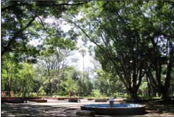
Figura 4. Alameda de Tepic Nayarit, México.

Tan solo la presencia de árboles y plantas en un ambiente urbano, es un poderoso elemento de identificación de los residentes de una localidad con sus espacios públicos, favoreciendo la construcción de valores comunes y creando vínculos sociales entre los ciudadanos (Lewis, 1992), idea que conecta con los enfoques del capital social aplicados a las áreas urbanas. Lewis (1996), Berman (1997) y Kuo et al. (1998) demostraron que los residentes de vecindarios con programas de urbanización, basados en la creación de áreas verdes, aumentan sus interacciones sociales y desarrollan un alto sentido de identidad y valores compartidos, incluso estrechando los lazos sociales entre los visitantes, en comparación con los desarrollados entre ciudadanos que vivían alejados de zonas verdes. No obstante la influencia de las zonas verdes urbanas en el aumento de los lazos sociales entre los ciudadanos sólo tiene éxito si la comunidad se ve implicada en la participación, uso, disfrute y creación de estos espacios naturales (Hester, 1984).